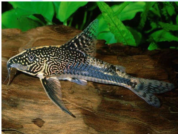
Scleromystax barbatus , male

Engl.: Banded Corydoras , Bearded Catfish, Bearded Corydoras