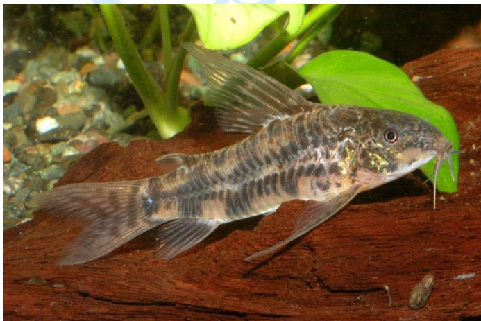
Scleromystax macropterus , male

Engl.: Hifin Peppered Cory, Bigfin Cory, Sailfin Cory